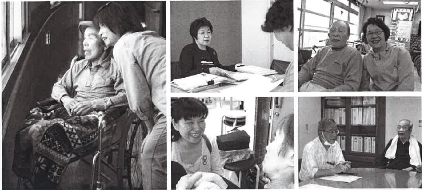
尾張東部圏域で活動する市民後見人の実際の活動風景